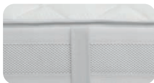
• Edle Konfektionierung mit Manufaktur-Details, Haute Couture