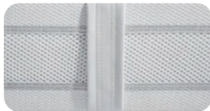
• Climaborder: Seitenböden mit Belüftungskanal und Handgriffen