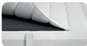
• Cover abnehmbar, waschbar und einzeln ersetzbar