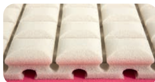
• Ventilation mit der sanften Oberfläche