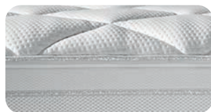
• Sanftes Oberflächen-Feeling mit integriertem MicroGel-Topper (abnehmbar, waschbar, ersetzbar)