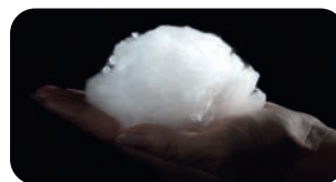
• Topper mit einzigartigen MicroGel-Fasern