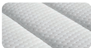
• riposa-Bezugsstoff mit Seide