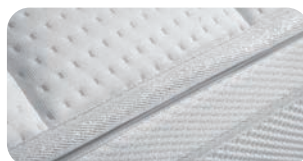
• riposa Platinumkante: Zeichen für Qualität und Perfektion, Haute Couture