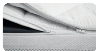
• SST-Verarbeitung mit Doppel-Reissverschluss für Topper und Cover