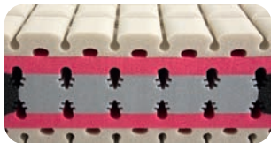
• Hybridkern mit einzigartiger Materialkomposition