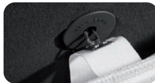
• Sorgfältige Manufaktur für Formbeständigkeit