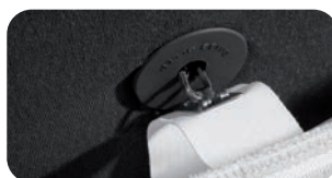
• Sorgfältige Manufaktur für Formbeständigkeit