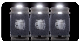
• Lordosenstütze (LORS) mit AirBox- und Federsystem