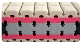
• Hybridkern mit einzigartiger Materialkomposition